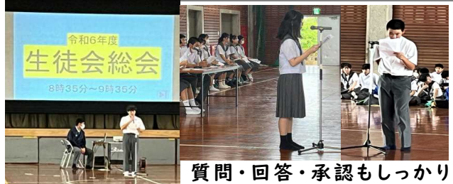
質問・回答・承認もしっかりと