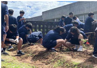
屋上にヘチマを植えました!実るといいなあ。

ぜひ、ご家庭でも将来の夢、卒業後の選択、今頑張りたいこと等を話題にしてください。